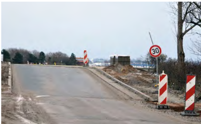
Besonders im Bereich des Steinwarder 1 ist das neue, deutlich höhere Straßenniveau gut zu erkennen

Heiligenhafen – Es ist zwar jetzt schon mehr als sechs Jahre her, aber für viele Heiligenhafener ist die Nacht vom 01. auf den 02. November 2006 noch äußerst präsent. Eine Jahrhundertflut suchte damals die Warderstadt heim und verursachte Schäden in Millionenhöhe. Damit das in dieser Form nicht wieder passiert, arbeitet die Stadt eifrig an ihrem Hochwasserschutz – und will nun auch die Bewohner des Steinwarders, die damals fast von der Außenwelt abgeschnitten waren, in besonderem Maße vor einer möglichen Überschwemmung bewahren. Rund sechs Millionen Euro investiert Heiligenhafen insgesamt in den Hochwasserschutz, zu dem auch der Schutz der Altstadt gehört. Die Anlagen sollen einen Schutz vor Wasserständen bis zu 2,50 Meter über Normal Null bieten.