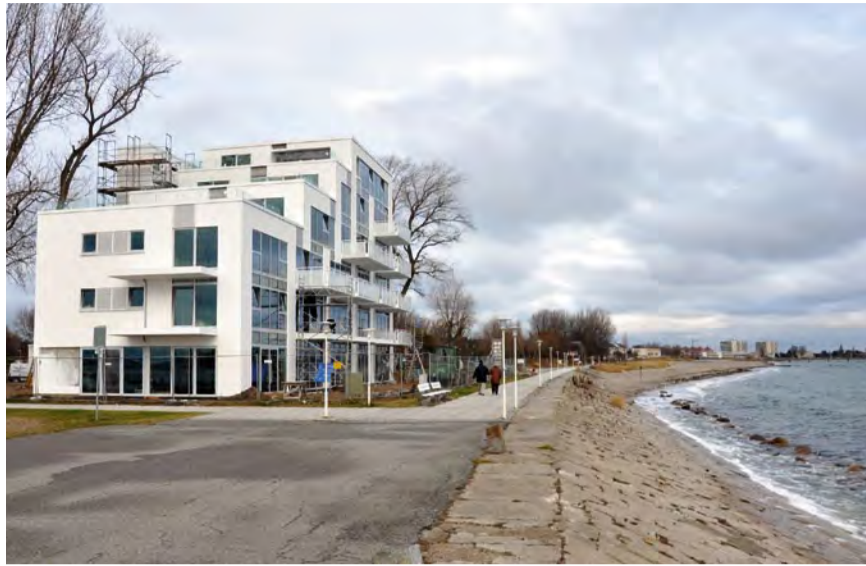
Letzte Außenarbeiten im November 2012

Großenbrode – Als einzigartiges Prachtstück wurde das Haus „Zur Mole“ angekündigt – und es hat gehalten, was wir versprochen haben! Auf dieses Apartmenthaus haben wir eine sehr positive Resonanz erhalten, von der wir selbst schon etwas überrascht waren. An der Großenbroder Mole in bester Lage zwischen Ostsee und Yachthafen gelegen, sucht es an der Küste seinesgleichen. 15 der insgesamt 16 Wohnungen sind bereits verkauft, in den oberen drei Etagen sogar noch vor Baubeginn. Informationen zur letzten noch zu verkaufenden Wohnung finden Sie im Immobilienteil auf dieser Seite. Die exklusiven Ferienwohnungen haben eine Größe von 45 bis 130 m 2 und verfügen alle über einen einmaligen, unverbaubaren Blick auf die Ostsee, von dem man nur träumen kann. Zwei Wohnungen und das Penthaus haben große Dachterrassen in Süd-West-Ausrichtung.