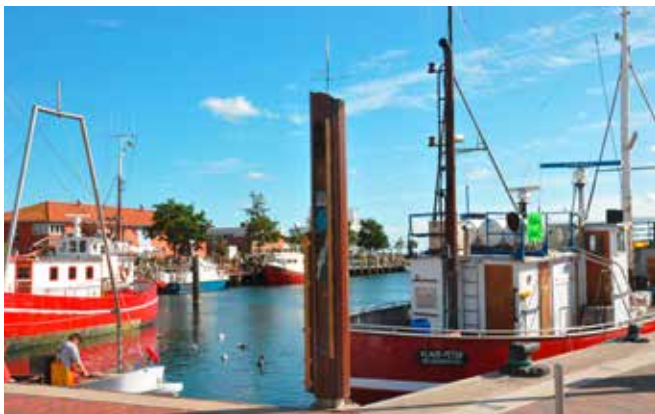
Der Historische Wasserstandsanzeiger am Kommunalhafen

Heiligenhafen – Wer in Heiligenhafen durch den Fischereihafen spaziert, wird in der Südwestecke am Hafenbecken auf eine neue Attraktion stoßen: einen Wasserstandsanzeiger. Bezahlt wurde die Anschaffung aus Spendenerlösen der Kult(o)urnacht, das Projekt umgesetzt hat die Bezirkshandwerkerschaft Heiligenhafen ohne Lohnberechnung.