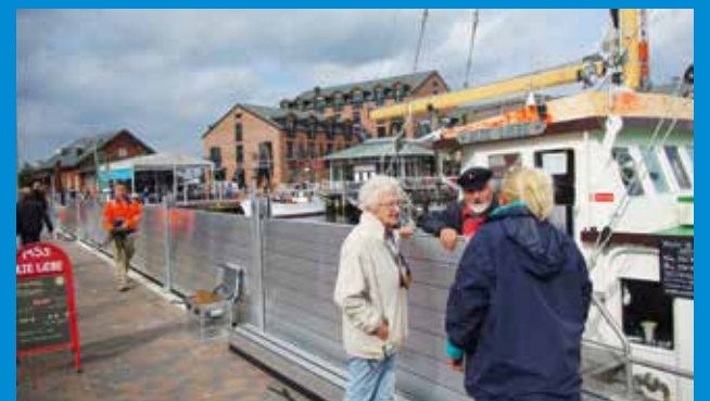
Die Hochwasser-Schutzwand in aufgebautem Zustand

Heiligenhafen – Was wurde nicht alles diskutiert und vorgeschlagen, wenn es in den vergangenen Jahren um den Hochwasserschutz in Heiligenhafen ging. Seit diesem Jahr bedient sich die Warderstadt nun einer pfiffigen Lösung und ist für die nächste Sturmflut gewappnet. Denn seit wenigen Monaten ist Heiligenhafen im Besitz einer mobilen Hochwasser-Schutzwand – 400 Meter lang und aus reinem Aluminium. Die Wand hat rund 1,8 Millionen Euro gekostet (1,3 Millionen Euro gab es als Fördermittel) und ist quasi der letzte Lückenschluss zwischen den anderen Schutzmaßnahmen. Bei der technischen