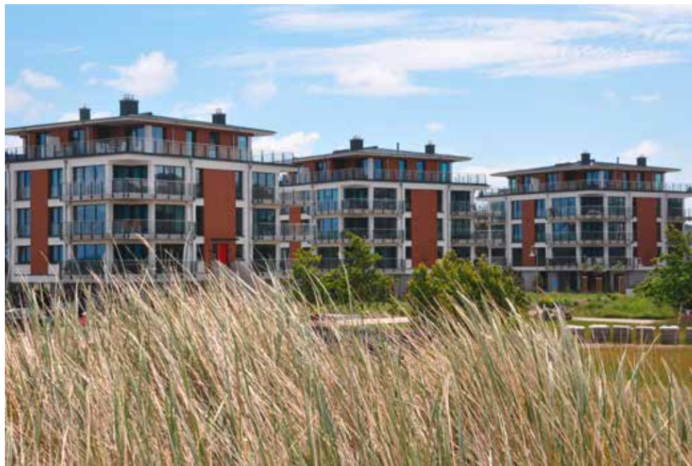
Die Häuser Ostseedüne, Dünenblick und Sanddüne vom I. Bauabschnitt...